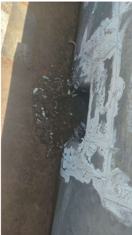
SAÍDA DE ÁGUA COM PROBLEMAS DE IMPERMEABILIZAÇÃO