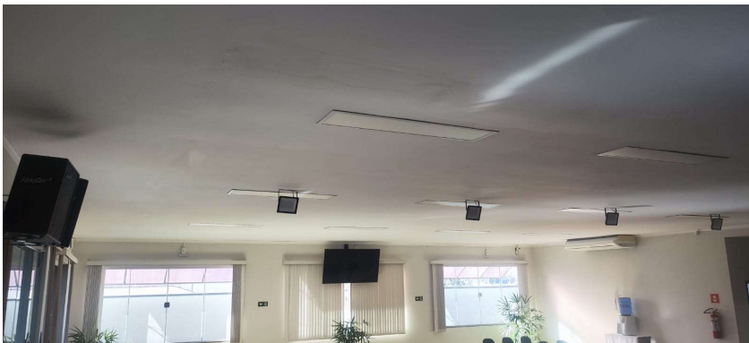
FORRO DE GESSO COM DETALHES