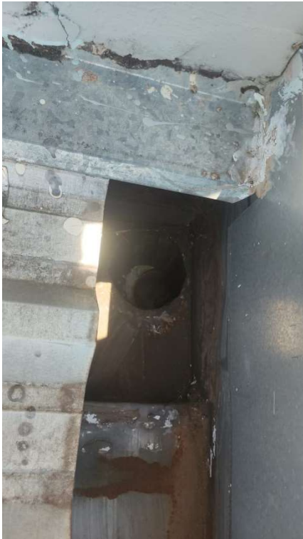
SAÍDA DE ÁGUA COM REDUÇÃO SEM MATERIAIS ADEQUADOS