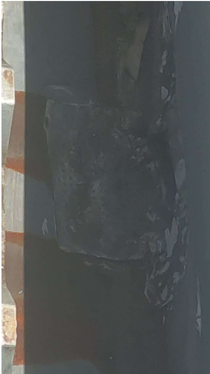
SAÍDA DE ÁGUA COM PROBLEMAS DE IMPERMEABILIZAÇÃO