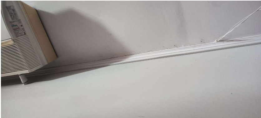
FORRO DE GESSO COM DETALHES