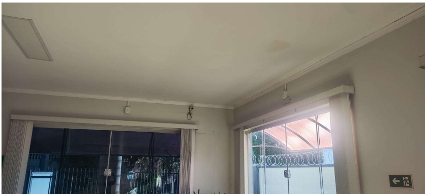
FORRO DE GESSO COM DETALHES